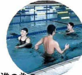
健康増進の為の 水中ウォーキング