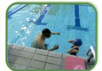
プライベートレッスン